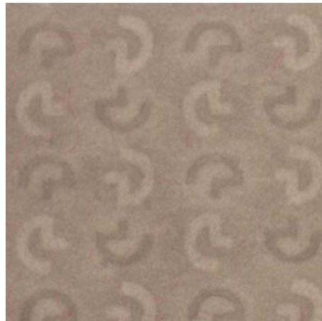
Popierius su nefiksuotu dvitoniu vandens ženklų